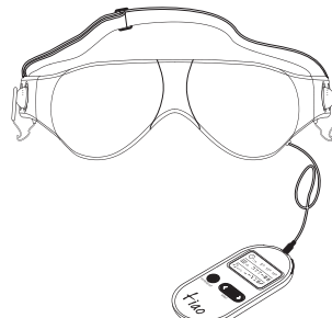
Masque, avec écouteurs intégrés et commande de contrôle