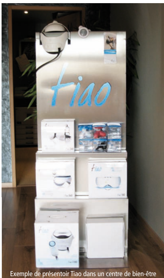
Exemple de présentoir Tiao dans un centre de bien-être

En échange du partenariat basé sur les 8 avantages indiqués précédemment, vous vous engagez à suivre la charte de qualité Tiao intégrée dans le contrat Tiao Expert. Cette charte vous assure que tous les centres Tiao Expert offrent des services à la mesure de vos propres services.